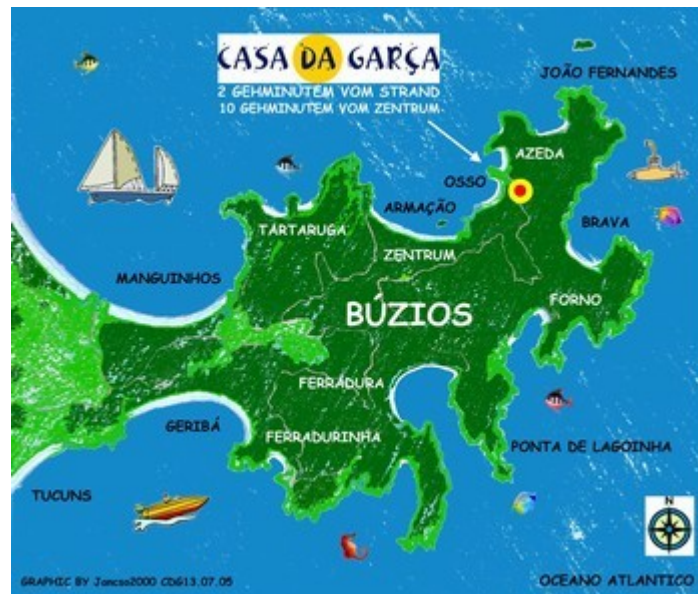
Die erwähnte Landzunge ins Meer