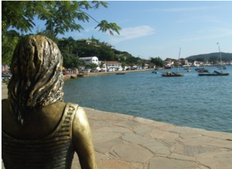
Die Statue von Brigitte Bardot

Der Ort wurde bekannt durch die französische Filmschauspielerin Brigitte Bardot , die dieses Kleinod als „Saint Tropez in Brasilien“ bezeichnete und daselbst immer noch ein Haus besitzt. Eine Uferpromenade trägt denn auch ihren Namen.