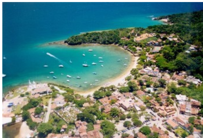
Wunderschöne Buchten und 18 Strände