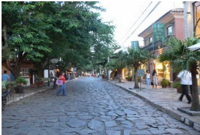
Flaniermeile von Búzios

im Zentrum sind alle Gebäude ebenerdig oder nicht höher als einstöckig. Der Grossteil der Geschäfte sind in den noch erhaltenen alten Fischerhäusern eingerichtet.